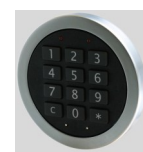
M-Locks 2020 Elektronikschloss