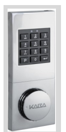
Kaba- Elektronikschloss CB 90 mit Notzugang