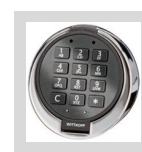
Gator- Elektronikschloss mit Notzugang