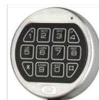
Elektronischs La Gard Basic