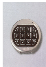
Elektronischs Schloss La Gard Basic