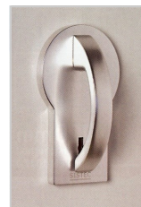
Grundmodul mit Doppelbartschloss