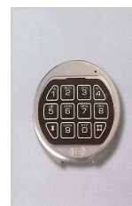
Elektronisches La Gard Basic