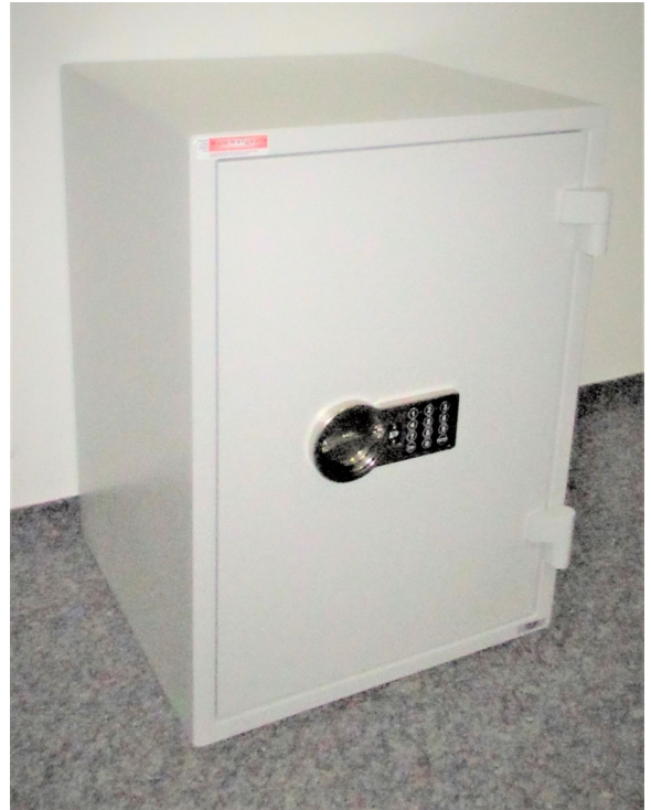
Modell FSB 67

Bestens geeignet für Dokumente, Akten und Wertsachen!