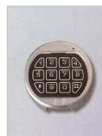
Elektronisches La Gard Basic