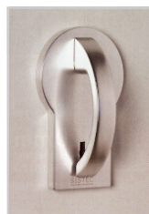
Grundmodul mit Doppelbartschloss