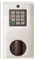
Elektronikschloss mit Notzugang