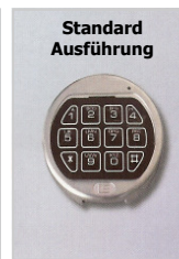
Standard Ausführung Elektronikschloss La Gard Basic